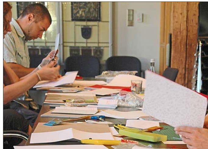
Der Tisch verschwindet allmählich unter Bergen von Papier.